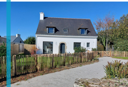
Le Haut du Nelud