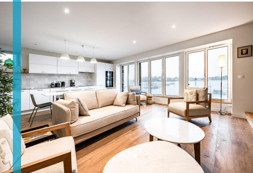
Villa du Port 6

Retrouvez tous nos logements sur Cocoonr.fr